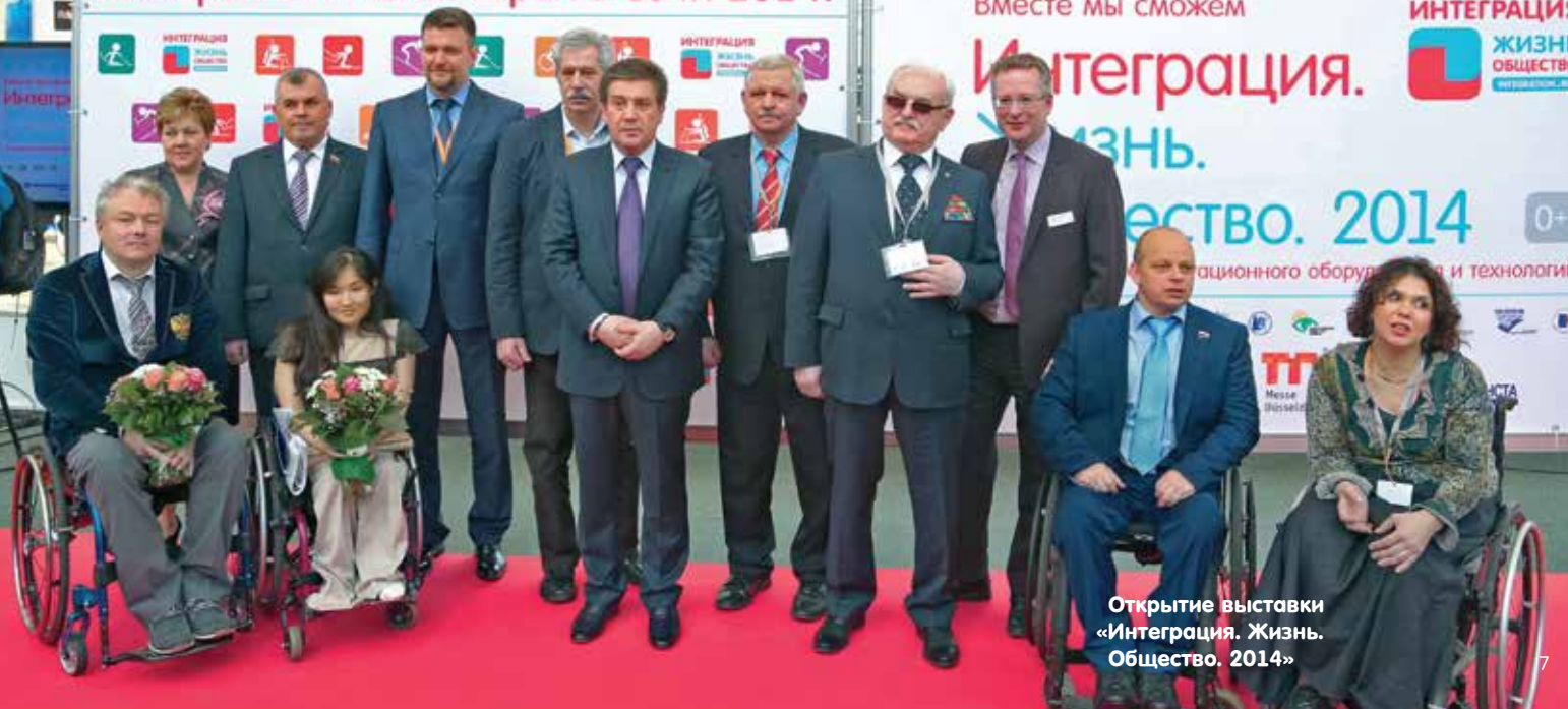
Открытие выставки «Интеграция. Жизнь. Общество. 2014»